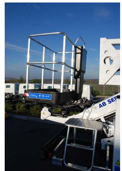
Panier tubulaire (en option)