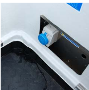
Prise 220V dans le panier avec disjoncteur différentiel 30mA