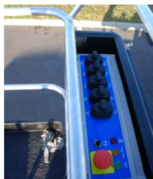
Commande proportionnelle électro hydraulique - une main